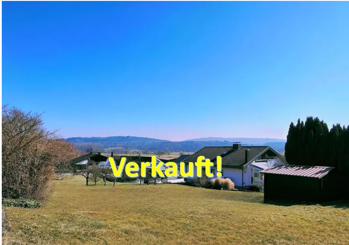
Volkertshausen - Verkauft